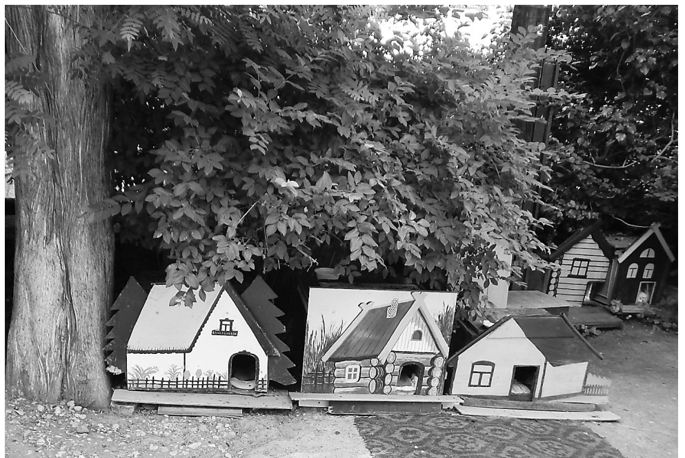
Большинство ялтинцев выступает за сохранение этих домиков для кошек.